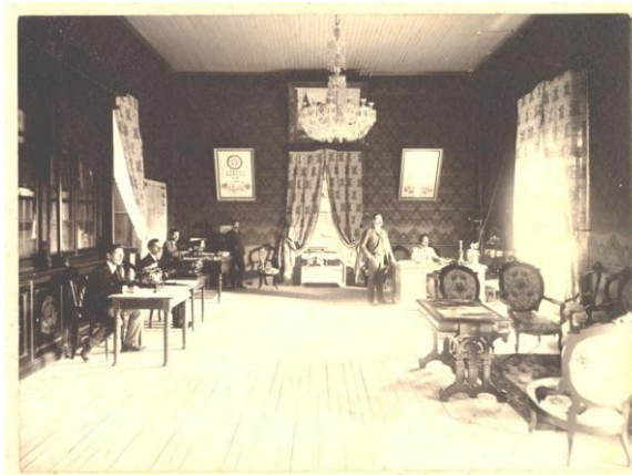
Ilustración 3. Oficina de Telégrafos. Ciudad de Guatemala, 1908 a 1910.