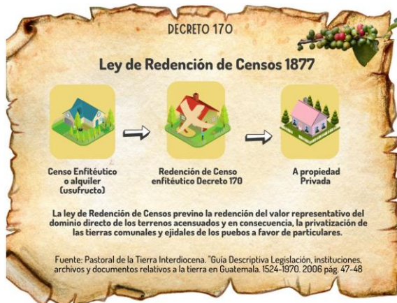
Ilustración 7. Ley de redención de censos 1877