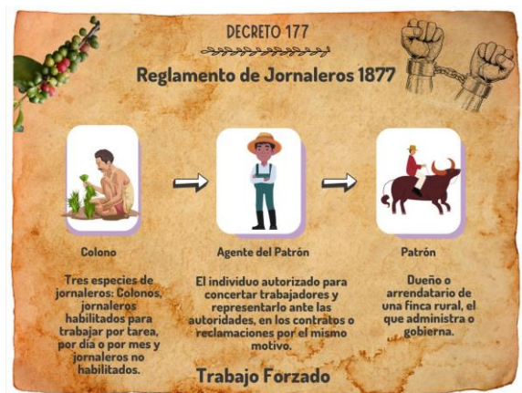
Ilustración 6. Reglamento de jornaleros 1877

El estado policía, que captura a los trabajadores, para beneficiar a los propietarios de la tierra. Con antecedentes de sujeción de la fuerza de trabajo colonial, los repartimientos y mandamientos.