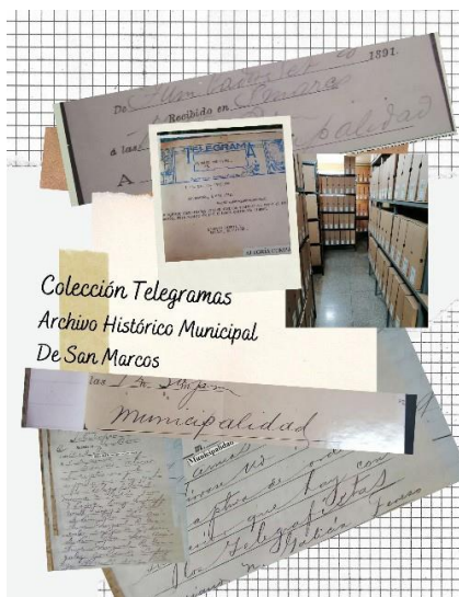
Ilustración 1. Colección de telegramas del Archivo Histórico Municipal de San Marcos

San Marcos, ubicado en un punto estratégico por su frontera con México y el papel político que jugó en el último cuarto del siglo XIX, de donde provienen personajes como los generales Justo Rufino Barrios y José María Reina Barrios originarios de este departamento y que a través de un sistema de dictaduras sentaron las bases legales para la denominada Reforma Liberal. Hechos históricos relevantes quedaron documentados a través de correspondencia oficial y privada, hoy resguarda en el fondo documental del Archivo Histórico Municipal de San Marcos AHMSM legado para la historia local.