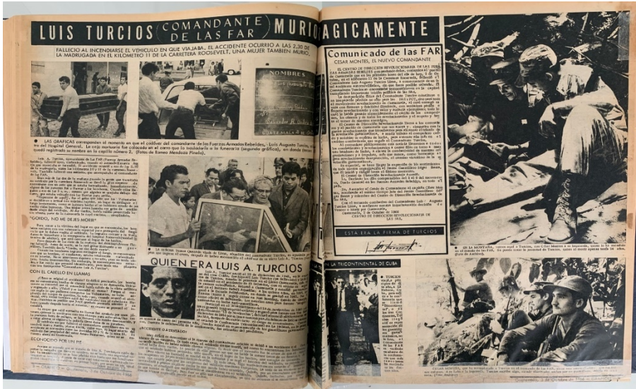
Figura 3. Páginas 8 y 9, diario El Gráfico del 3 de octubre de 1966.