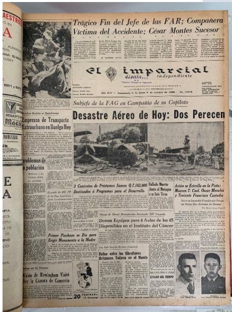
Figura 2. Primera plana de El imparcial del 3 de octubre de 1966.